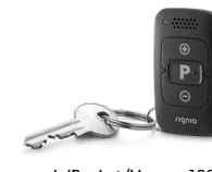
miniPocket (Varenr. 1093 9860)