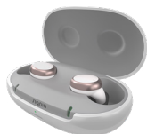
Active Pro Oplader (varenr. 1099 1346)