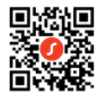
StreamLine TV koppeln