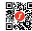
Hörgeräte mit App und Smartphone koppeln