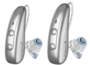
Pure C&G IX Pure C&G T IX

Dann ist Pure Charge&Go (T) IX genau das Richtige.