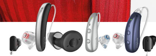
Signia IX Hörgeräte