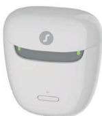
Pure chargeur portable