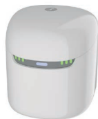
Pure Dry&Clean chargeur